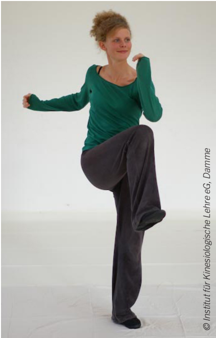
Abb. 2: Die Überkreuzbewegungen sind eine Übung aus dem Brain Gym®. Zahlreiche Brain Gym®-Übungen eignen sich auch für Laien als Selbsthilfe, um Reflexe zu integrieren.